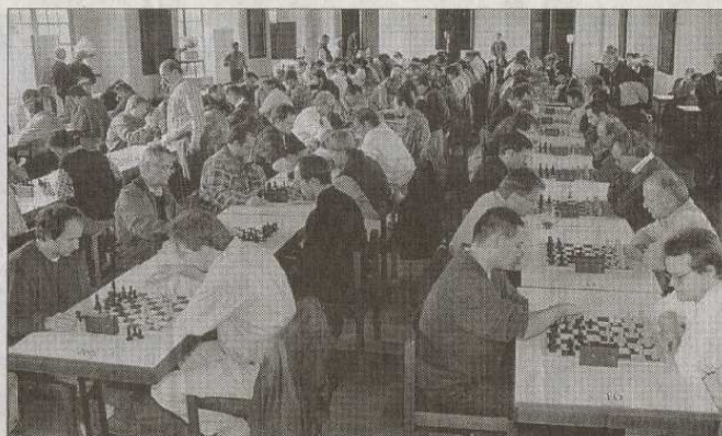
DAS TURNIER war nicht nur von der Teilnehmerzahl her gut besetzt. Auch vier internationale Großmeister reisten an. tae/Photo: Heigl